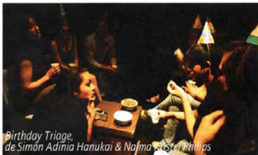
Birthday Triage, de Simón Adinía Hanukai & Naïma Essler Philips

Il ne faut pas que la dimension sociale de l'immersion s'arrête à la fin de la représentation. Il faut ensuite amener les gens à échanger sur ce qu'ils ont vu