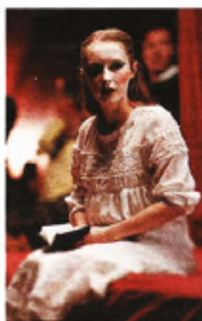
Helsingør À partir du 24 sept., au château de Vincennes.

Le spectacle est une œuvre de théâtre qui explore les thèmes de l'identité, de la réalité et de la perception. Le spectacle est une œuvre de théâtre qui explore les thèmes de l'identité, de la réalité et de la perception.