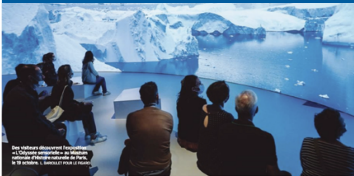
Des visiteurs découvrent l'exposition « L'Odyssée sensorielle » au Muséum national d'histoire naturelle de Paris, le 19 octobre.