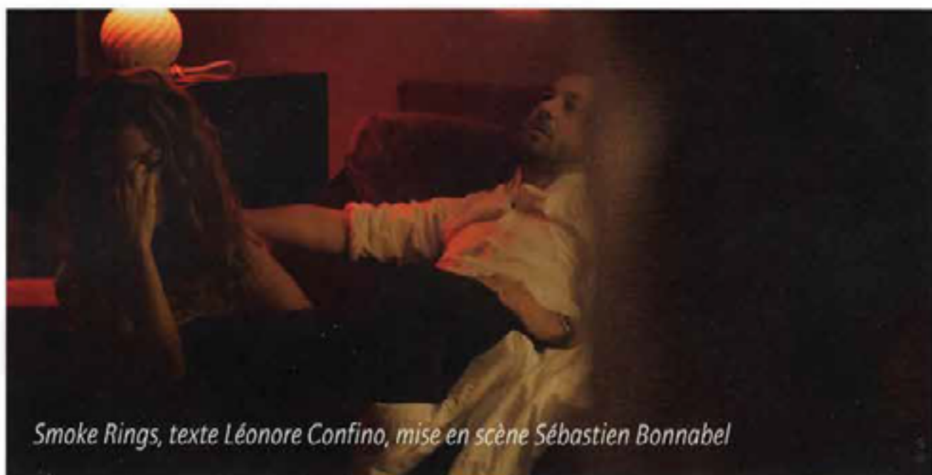
Smoke Rings, texte Léonore Confino, mise en scène Sébastien Bonnabel

Le public est très habitué aujourd'hui au format cinéma et à Internet ; cela veut dire qu'il est abreuvé d'émotions en gros plans, alors quand il se retrouve au théâtre dans une proximité telle que d'un seul coup un acteur le regarde dans les yeux, ça provoque une émotion très forte