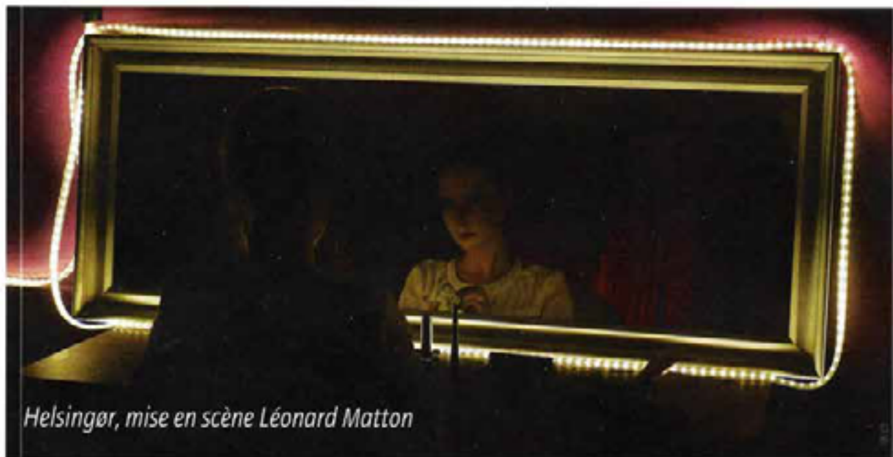
Helsingør, mise en scène Léonard Matton

Dans le théâtre classique on utilise seulement nos yeux et nos oreilles. Dans le théâtre immersif, on utilise tous nos sens et tout le corps