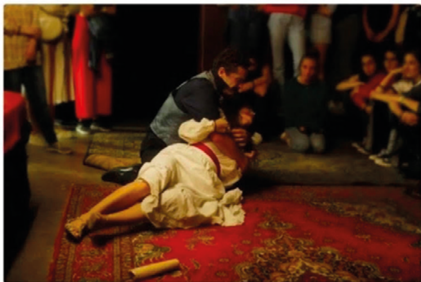
« Helsingør, château d'Hamlet », une version au plus près du public qui fait mouche. À voir au château de Vincennes.

"Les Démons", "Helsingør, château d'Hamlet", "Monsieur Motobécane"... Découvrez les meilleures pièces qui jouent ce mois-ci à Paris, et ce que "Télérama" en a pensé.