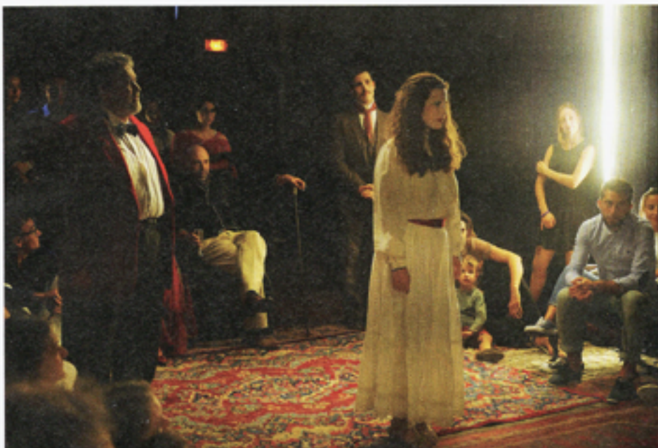
Lieu éphémère D'un château à l'autre : d'Elseneur à Vincennes, Hamlet reprend vie.

L'idée ? Elle a infusé, par strates, dans l'esprit du créateur. « En 2011, j'ai entendu parler de Sleep No More , un Macbeth immersif, principalement chorégraphique, monté dans 9 000 m 2 par la compagnie britannique Punchdrunk. Je ne l'ai pas vu, mais le principe m'intriguait et je me demandais s'il pouvait fonctionner pour Hamlet . À la même