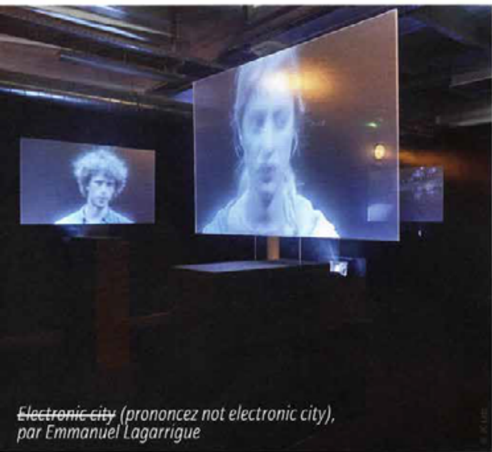
Electronic city (prononcez not electronic city), par Emmanuel Lagarrigue